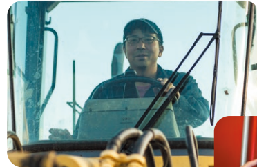
牧場での作業に必要な大型特殊免許や作業免許の取得も支援しています。

人材育成はサホロミルク内でのOJTに加え、本人の希望に応じて、出資している個人・法人の牧場を研修先を選べるのが大きな特徴です。出資農家の中には、道内屈指のメガファームや加工業に力を入れる牧場など営農方針も様々で、将来自分がやりたいことへの参考にもなります。また一部の個人農家では将来の後継者や副牧場長など、牧場の未来を託す人材を募っており、研修をきっかけに事業継承のチャンスが生まれる可能性もあります。